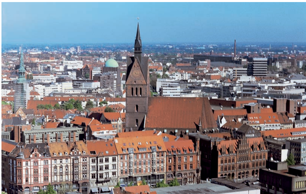
Blick auf Hannover: Von wegen lauteste Stadt – die korrekten Zahlen müssen verglichen werden.